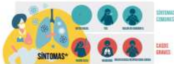
*Los síntomas pueden aparecer de 2 a 14 días después de la exposición al virus.

COVID-19 es una enfermedad respiratoria nueva que se identificó por primera vez en Wuhan, China. Actualmente, la propagación se da principalmente de persona a persona.